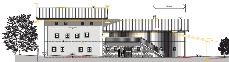
Südansicht Thurnhaus (Arch. DI Ulrich Stöckl, Saalfelden)

Das Bergbau- und Gotikmuseum und die Hüttschmiede sind trotz der Sanierungsarbeiten zu den üblichen Öffnungszeiten für Sie geöffnet. Nähere Informationen dazu unter www.museum-leogang.at .